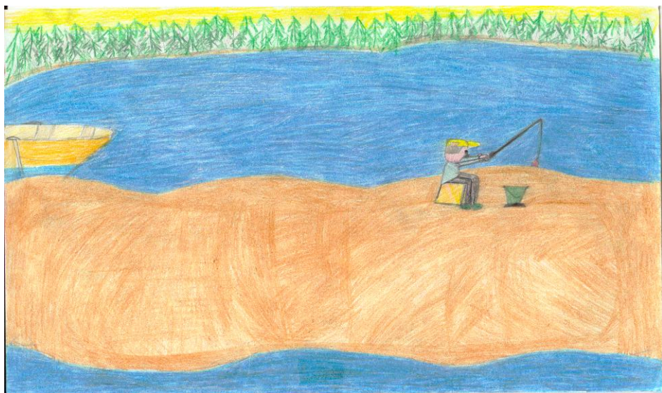
Канева Светлана «Река Печора» (3-Б кл., шк. №5)