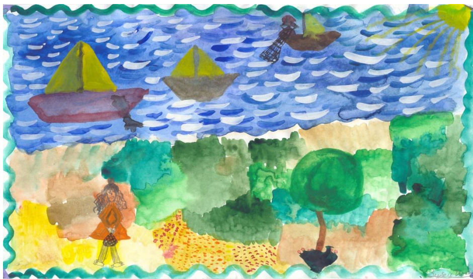
Зубец Ирина «Река Печора» (2-А кл., шк. №3)