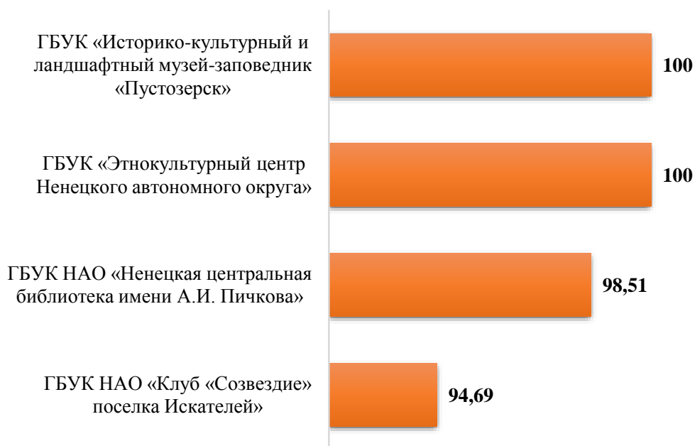
Рис.6. Рейтинг организаций по критерию «Удовлетворенность условиями оказания услуг»

В целом, принимая условия, что высокими считаются итоговые рейтинговые баллы в пределах от 500 до 400 баллов, средними от 400 до 300 и низкими от 300 до 0, отмечается, все учреждения культуры, принявшие участие в независимой оценке на территории Ненецкого автономного округа, получают высокие рейтинговые баллы: 4 организации из 4. Это говорит о высоком уровне качества оказания услуг учреждениями культуры региона.