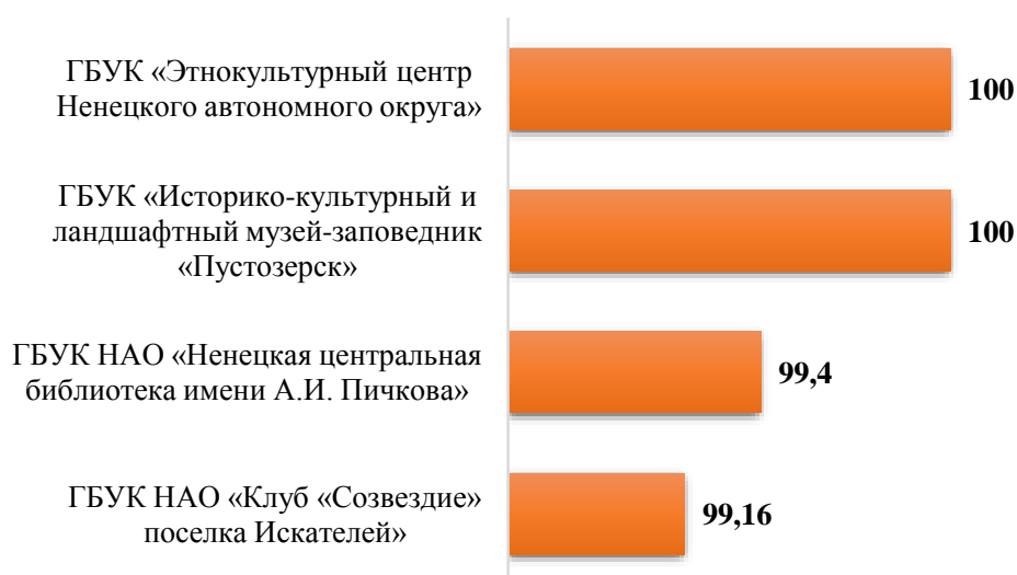
Рис.2. Рейтинг организаций по критерию «Открытость и доступность информации об организации социальной сферы»

Незначительно более низкие оценки зафиксированы в ГБУК НАО «Ненецкая центральная библиотека имени А.И. Пичкова» (99,4 баллов из 100) и ГБУК НАО «Клуб «Созвездие» поселка Искателей» (99,16 баллов из 100). рис.2.