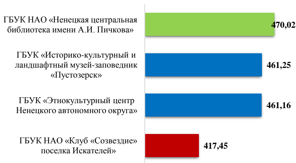
Рис.1. Общий рейтинг учреждений культуры, балл

Таким образом, можно говорить, что лучшие значения среди учреждений культуры зафиксированы у ГБУК НАО «Ненецкая центральная библиотека имени А.И. Пичкова» (470,02 баллов). Высокие баллы получают также ГБУК «Историко-культурный и ландшафтный музей-заповедник «Пустозерск» (460,25 баллов) и ГБУК «Этнокультурный центр Ненецкого автономного округа» (461,16 баллов). Чуть меньше других баллов получает ГБУК НАО «Клуб «Созвездие» поселка Искателей» (417,45 баллов). Однако с учетом того, что максимально возможный балл в ходе независимой оценки составляет 500 баллов, а все учреждения культуры, принявшие участие в оценке, получили более 400 баллов, необходимо сказать о высоком уровне качества предоставления услуг учреждениями культуры Ненецкого автономного округа.