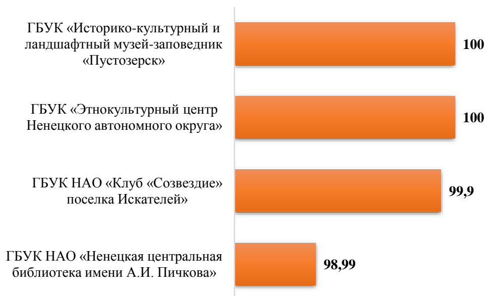
Рис.5. Рейтинг организаций по критерию «Доброжелательность, вежливость работников организаций социальной сферы»

По критерию «Удовлетворенность условиями оказания услуг», как и по критерию «Доброжелательность, вежливость работников организаций социальной сферы», все организации набрали высокие баллы.