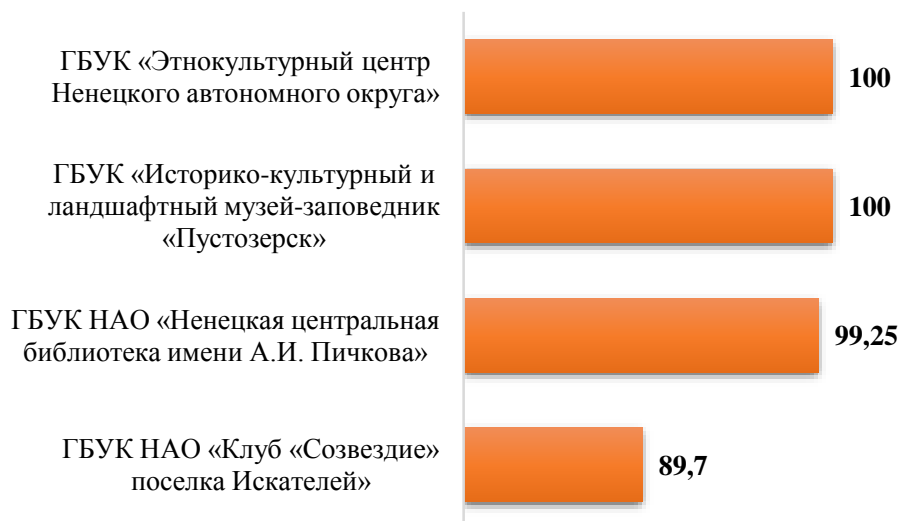
Рис.3 Рейтинг организаций по критерию «Комфортность условий предоставления услуг»

По критерию «Доступность услуг для инвалидов» наиболее высокие баллы показывает ГБУК НАО «Ненецкая центральная библиотека имени А.И. Пичкова» (73,87 баллов из 100). Баллы чуть выше среднего получили ГБУК «Историко-культурный и ландшафтный музей-заповедник «Пустозерск» (61,25 баллов из 100) и ГБУК «Этнокультурный центр Ненецкого автономного округа» (61,16 баллов из 100).