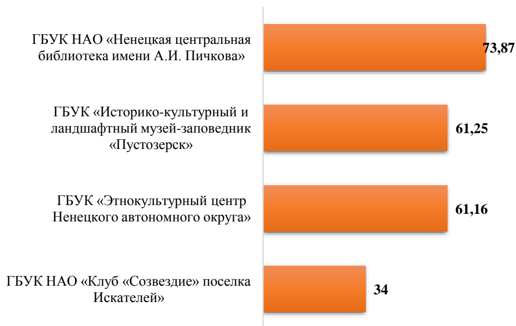
Рис.4. Рейтинг организаций по критерию «Доступность услуг для инвалидов»

Критерий «Доброжелательность, вежливость работников организаций социальной сферы», как правило, набирает наиболее высокие баллы во всех учреждениях. Отмечается, что в большинстве случаев получатели услуг удовлетворены доброжелательностью и вежливостью сотрудников учреждений культуры. Максимально возможные баллы получили: ГБУК «Историко-культурный и ландшафтный музей-заповедник «Пустозерск» (100 баллов из 100), ГБУК «Этнокультурный центр Ненецкого автономного округа» (100 баллов из 100) и ГБУК НАО «Клуб «Созвездие» поселка Искателей» (99,9 баллов из 100). Чуть ниже баллы у ГБУК НАО «Ненецкая центральная библиотека имени А.И. Пичкова» (98,99 баллов из 100). Рис.5.